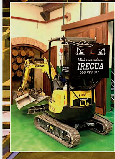
Gracias al modo eléctrico de la Yanmar ViO17 es posible realizar todo tipo de trabajos de interior de manera totalmente limpia y ecológica sin comprometer las prestaciones de la miniexcavadora.

En definitiva, es una máquina fácil de usar, fiable y eficiente, muy rentable, y permite operar tanto en interior como en exterior gracias a su bajo nivel de ruido y sus cero emisiones. •