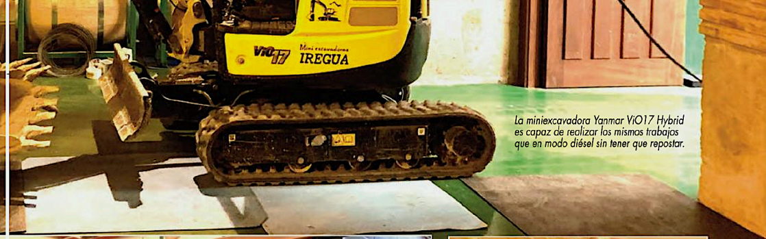
La miniexcavadora Yanmar ViO17 Hybrid es capaz de realizar los mismos trabajos que en modo diésel sin tener que repostar.