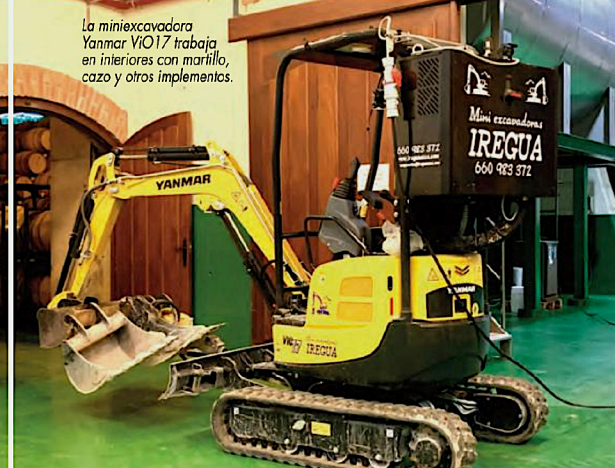
La miniexcavadora Yanmar ViO17 trabaja en interiores con martillo, cazo y otros implementos.